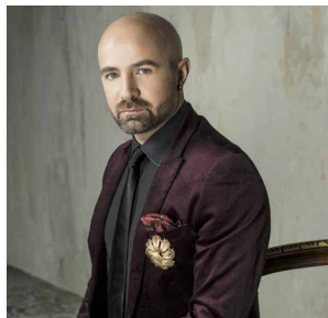
Max Emanuel Cencic

Tel. 030 / 20 35 45 55 | www.staatsoper-berlin.de