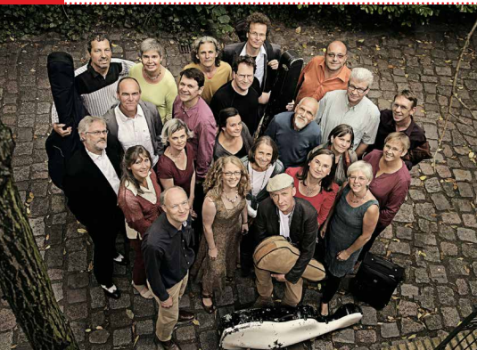
Akademie für Alte Musik Berlin